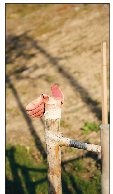
Handarbete pågår. Begravningsplatsen invigs på tisdag.