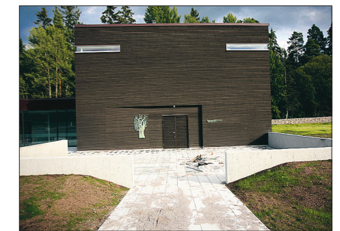
Neutral. Ceremonibyggnaden Stillheten ska också rymma andra arrangemang än begravningsrelaterade.