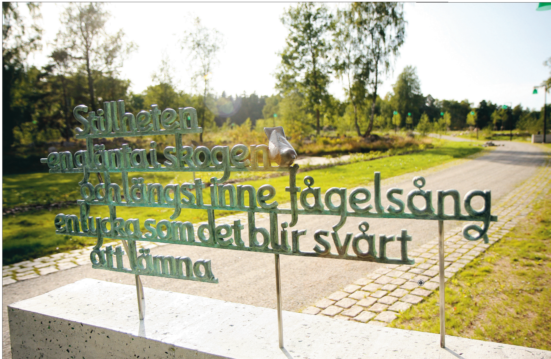
En plats för alla. Täbys nya, södra begravningsplats i ligger mitt emot dagens kyrkogård i Täby kyrkby.