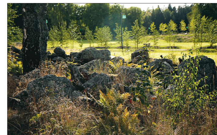
Inte först. Bland stengärgårdarna finns uråldriga gravplatser.

” Ingen, som i livet till exempel varit motståndare till kyrkan, ska vara tvungen att ligga på en kyrkogård.