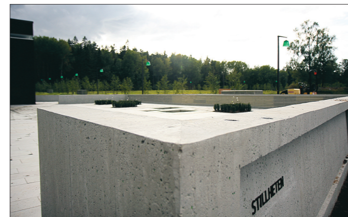
Stramt och stilla. Betong, mörklaserat trä och grönad brons ramar in platsen.